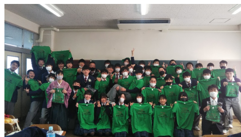
高校 3 年生最後の学校祭が延期になり諦めていたクラス T シャツを作成

https://www.youtube.com/watch?v=Ps8EGcw_uZ8