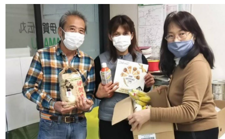
外国にルーツある人への食糧支援 (特定非営利活動法人 伊賀の伝丸)

①「外国にルーツがある人々への支援活動応援助成」は、新型感染症の影響によって、生活に困窮する、社会的に孤立する、必要な情報や医療につながりにくい等、さまざまな困難の状況にある外国にルーツがある人たちへの多様な支援活動を応援するもので、9月下旬から助成応募受付開始を予定しています。また、②「医療ケア児や障がいがある子どもたちの療養環境を向上させる活動を応援する助成」については、2021年内の助成応募受付開始を予定しています。