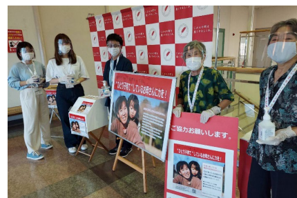
新型コロナウイルス ワクチン接種会場にて募金協力の呼びかけ

行政などでも、生理用品を配布する取り組みに着手する地域が増えていますが、配布が窓口受付であることから、利用をとまどう方も多いといえます。このキャンペーンでは、利用者の側に立って、訪問による手渡しなどを行うことによって、利用する際の心理的な不安を軽くするよう、配慮しながら展開されています。